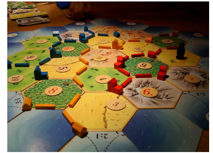
Selbstmanagement ein Strategiespiel?

rund und manches Thema bräuchte mehr Zeit und Raum, den wir an anderer Stelle gerne geben. Und hoffentlich konnten wir mit diesem Schnupperkurs Anstöße geben, die etwas ins Rollen brachten!? Wäre das nicht auch etwas für Sie?